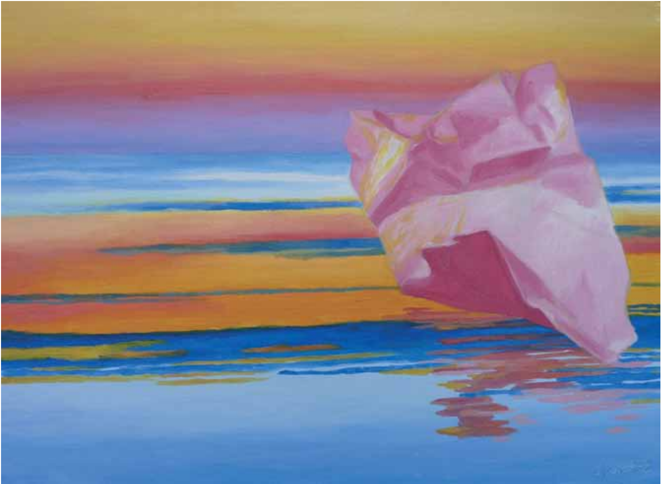
Il movimento del vento 2012 olio su cartone telato 50x70