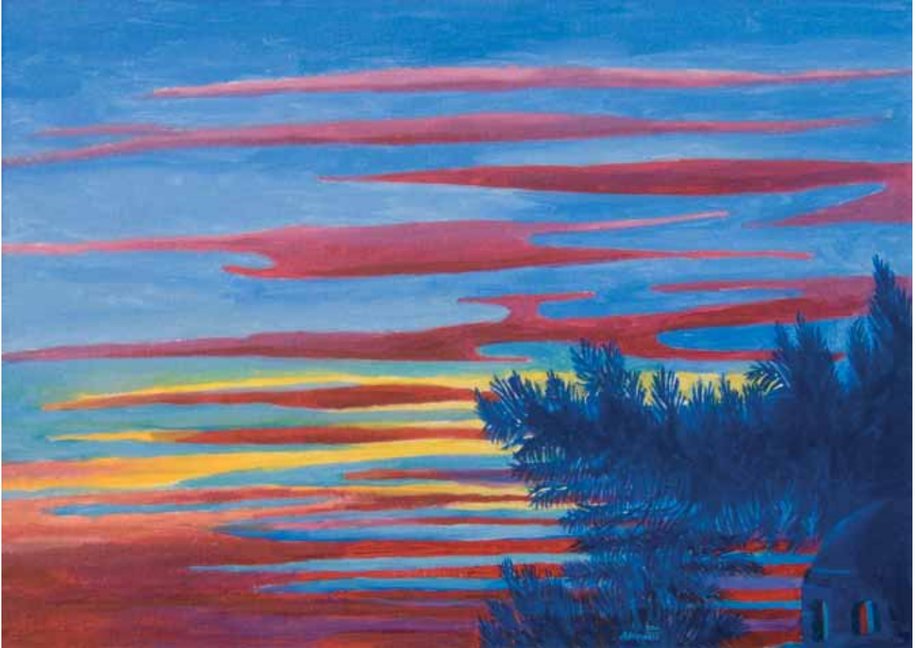
Ciclo atmosfere zartine 3 2011 olio su cartone telato 50x70