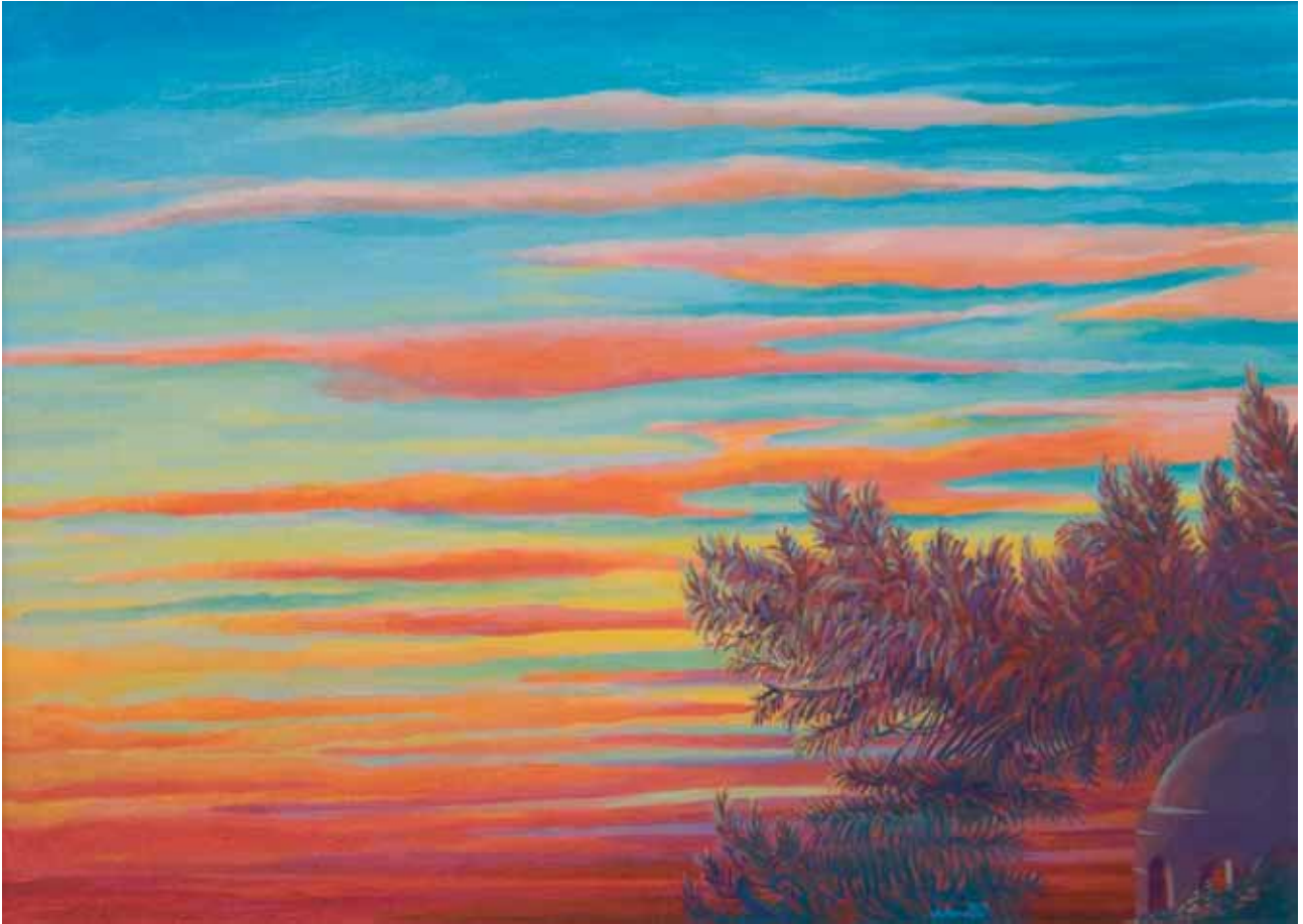
Ciclo atmosfere Zaratine 1 2011 olio su cartone telato 50x70