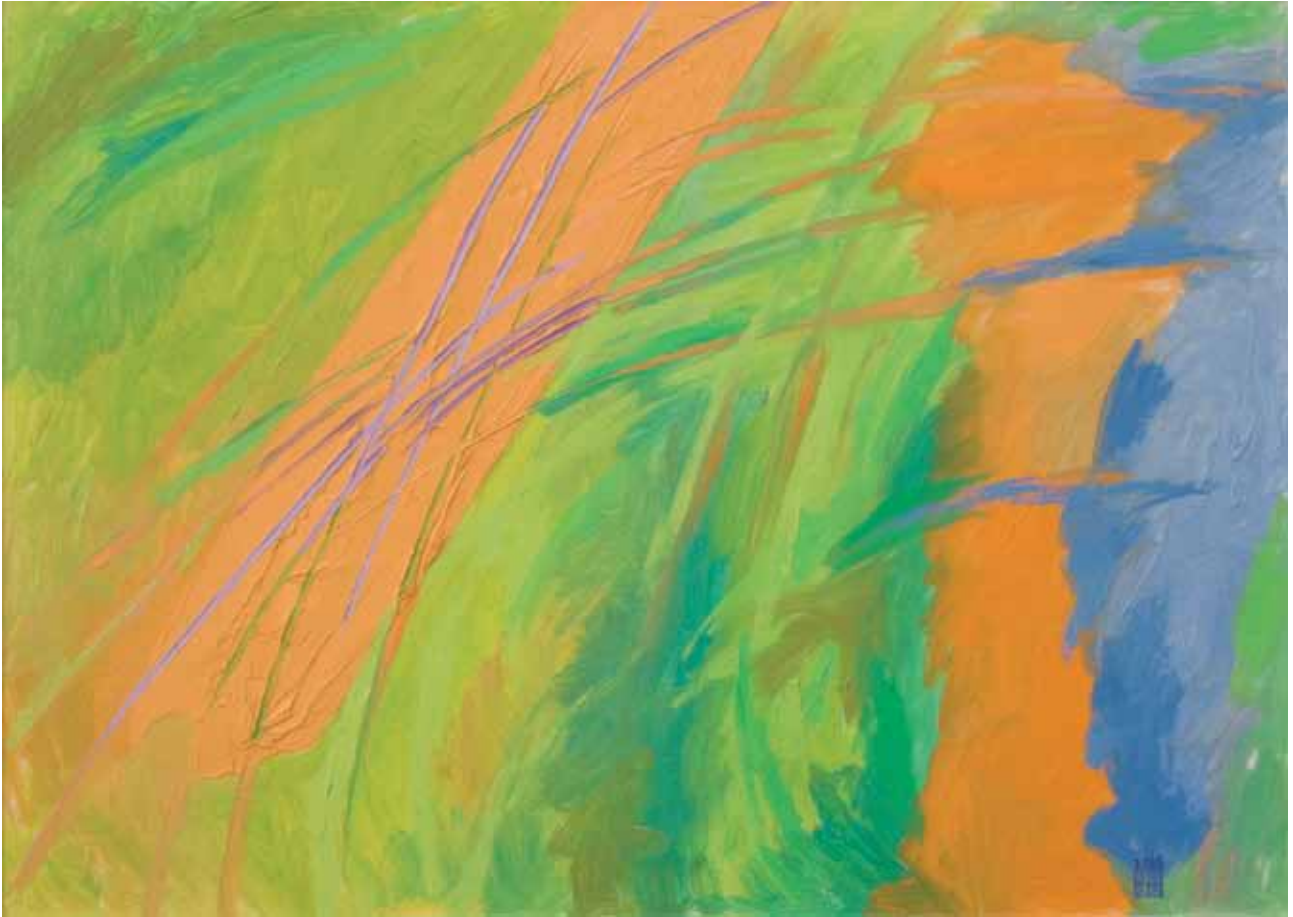
Riverberi arancio 2008 olio su cartone telato 50x70