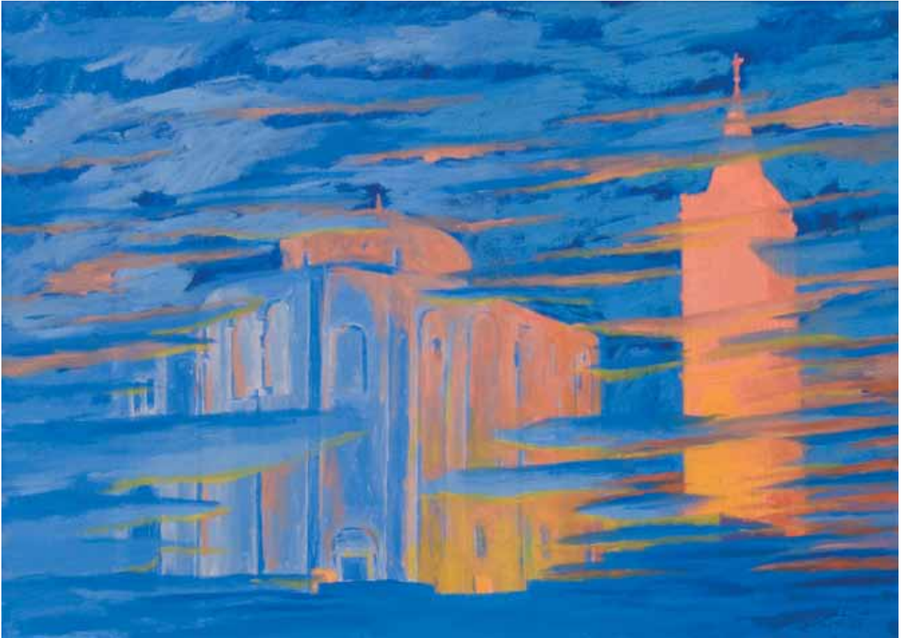
San Donato e campanile di Santa Anastasia 2012 olio su cartone telato 50x70