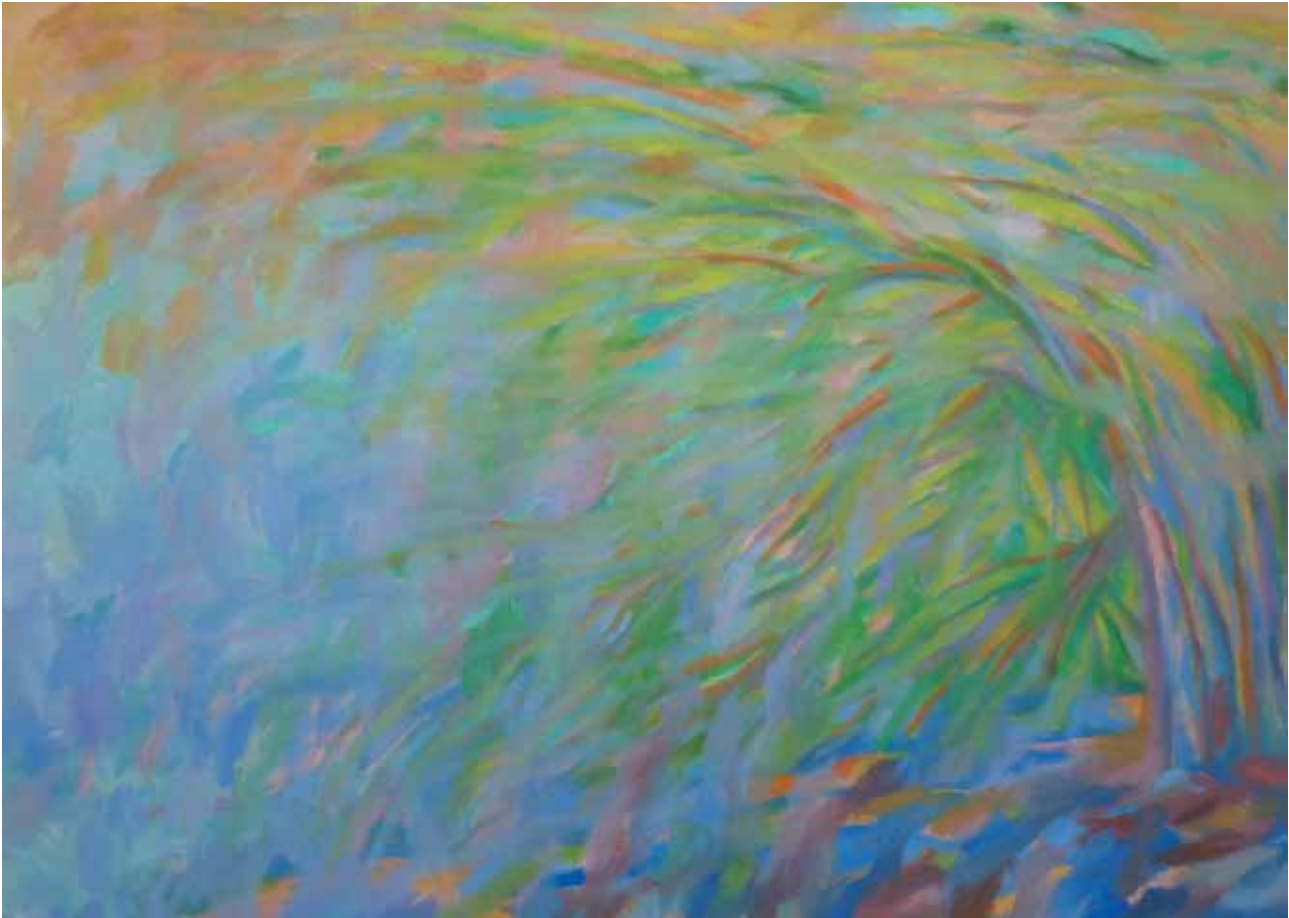
bosco dei pini 2006 olio su cartone telato 50x70