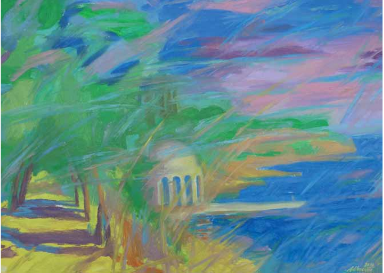
Tranquillità alla Fontana 2012 olio su cartone telato 50x70