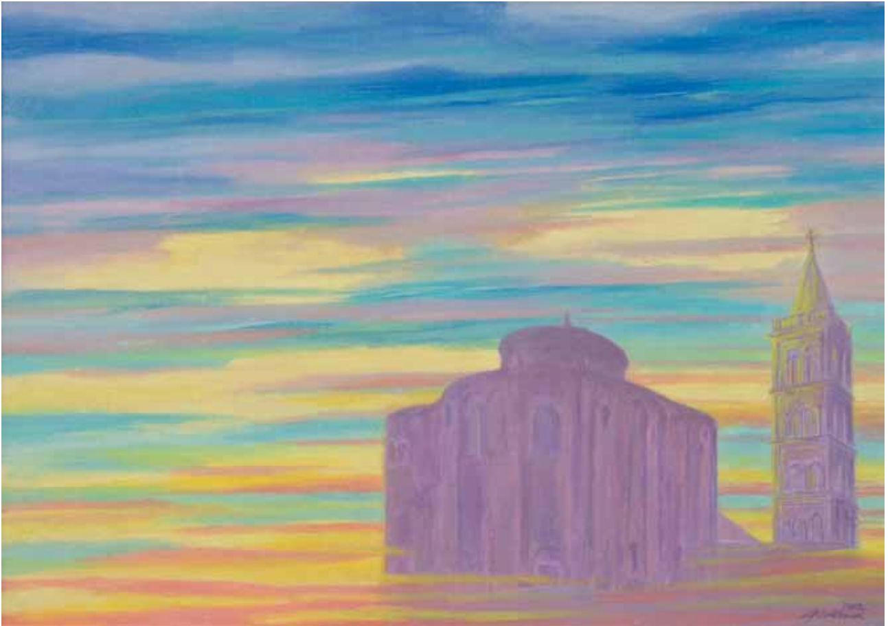
Alba a San Donato 2012 olio su cartone telato 50x70