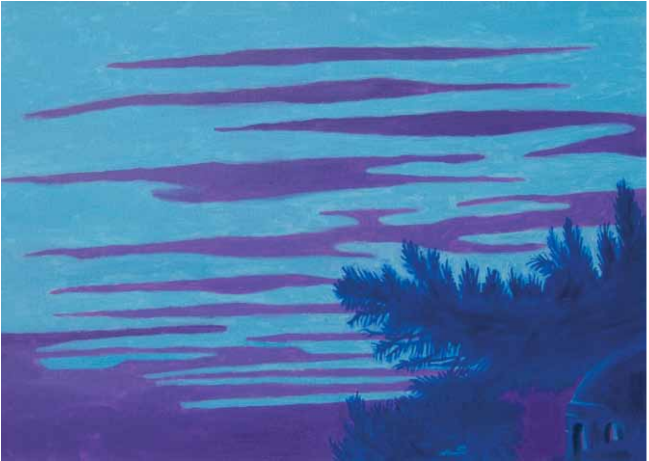
Ciclo atmosfere zartine 4 2011 olio su cartone telato 50x70