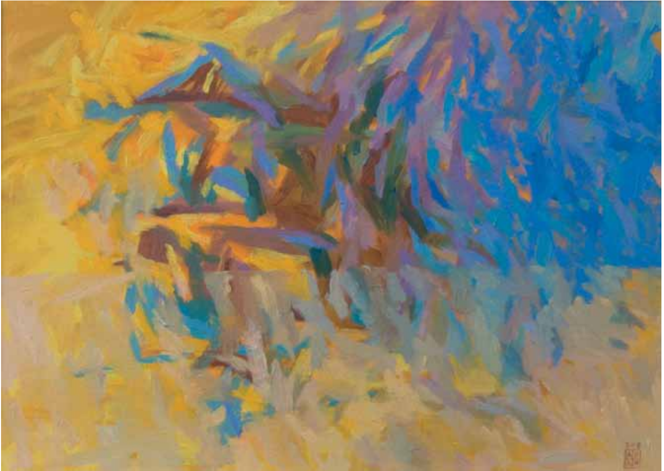
Orizzonte 2009 olio su cartone telato 50x70