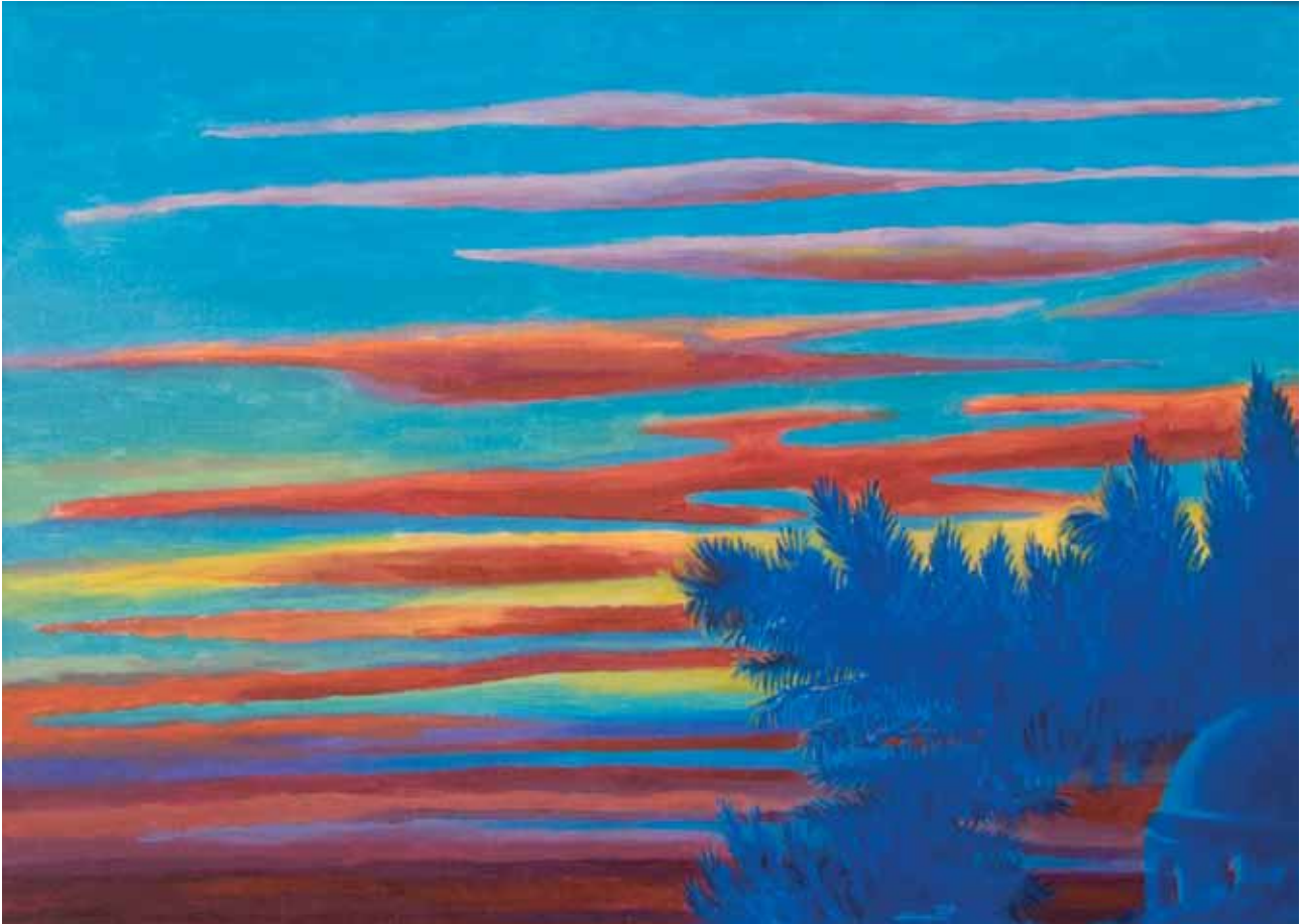
Ciclo atmosfere zartine 2 2011 olio su cartone telato 50x70