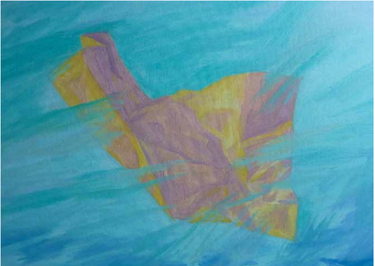
Il colore della Bora 2012 olio su cartone telato 50x70