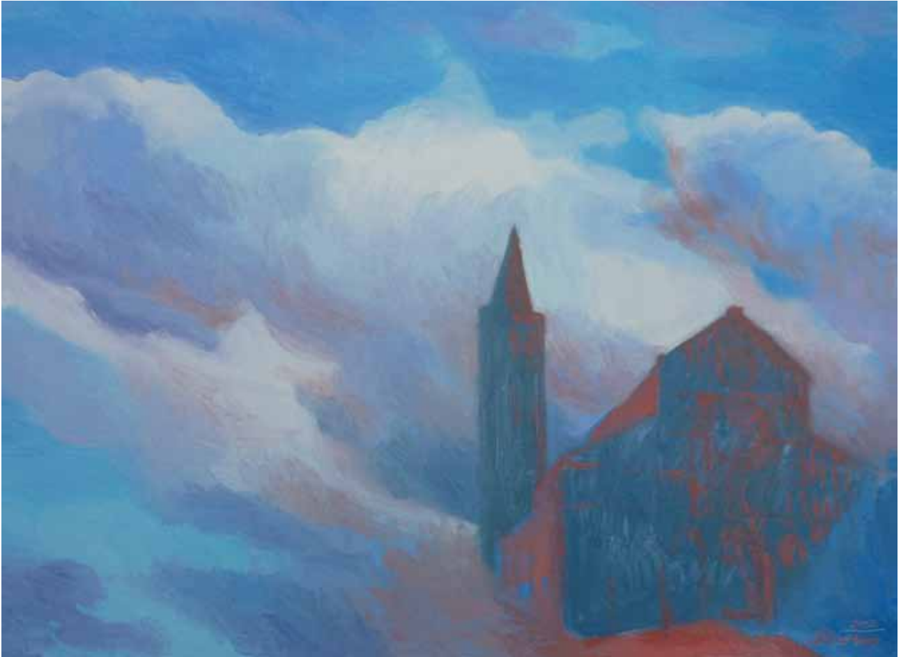
Santa Anastasia 2012 olio su cartone telato 50x70