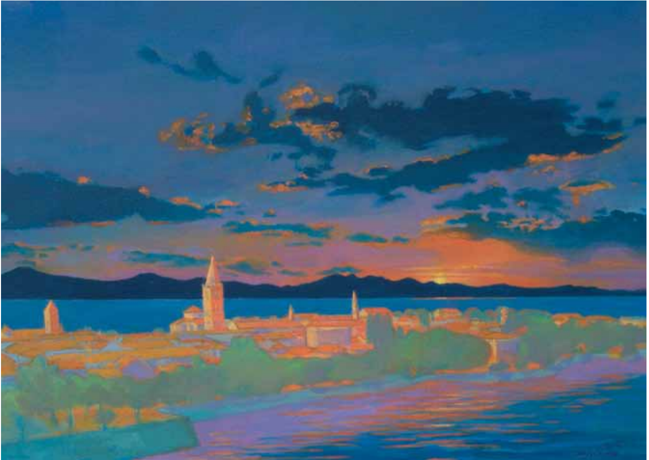
Zara 2012 olio su cartone telato 50x70