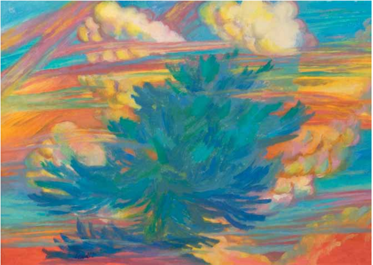
Albero alle Colovare 2012 olio su cartone telato 50x70