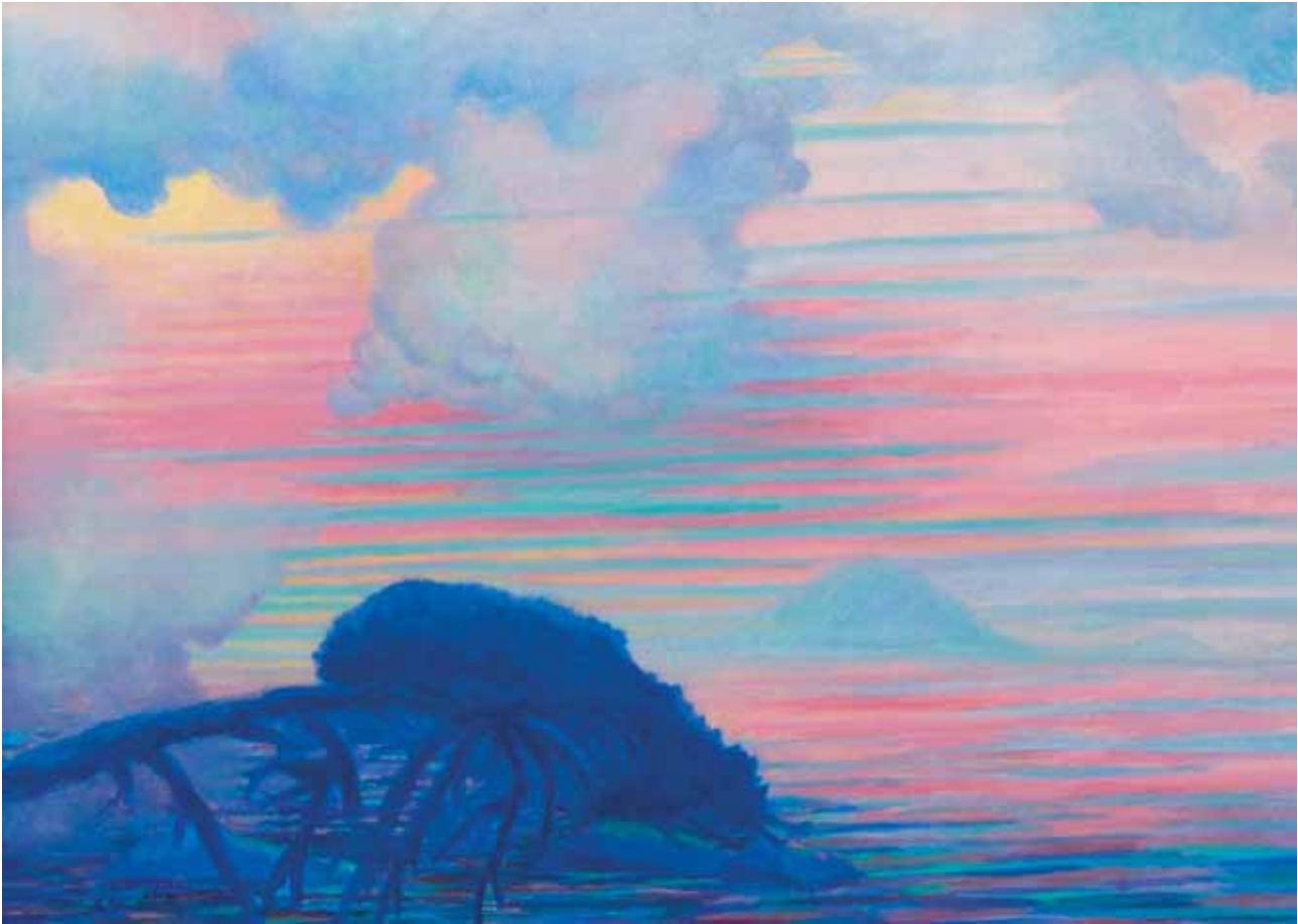
Pino spezzato 2012 olio su cartone telato 50x70